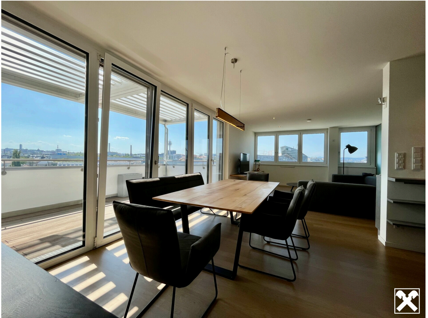
Essbereich Bild 1