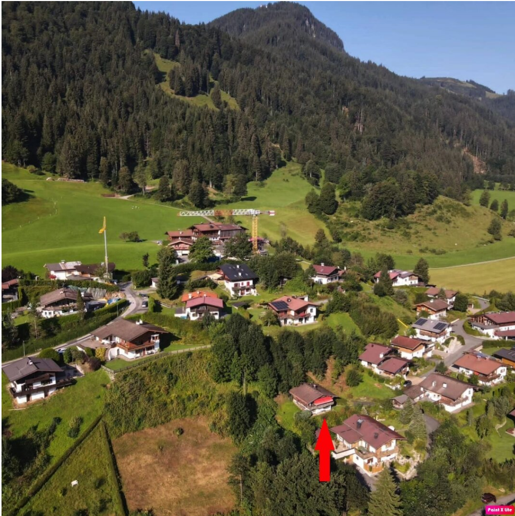
Immobilien in Kitzbühel