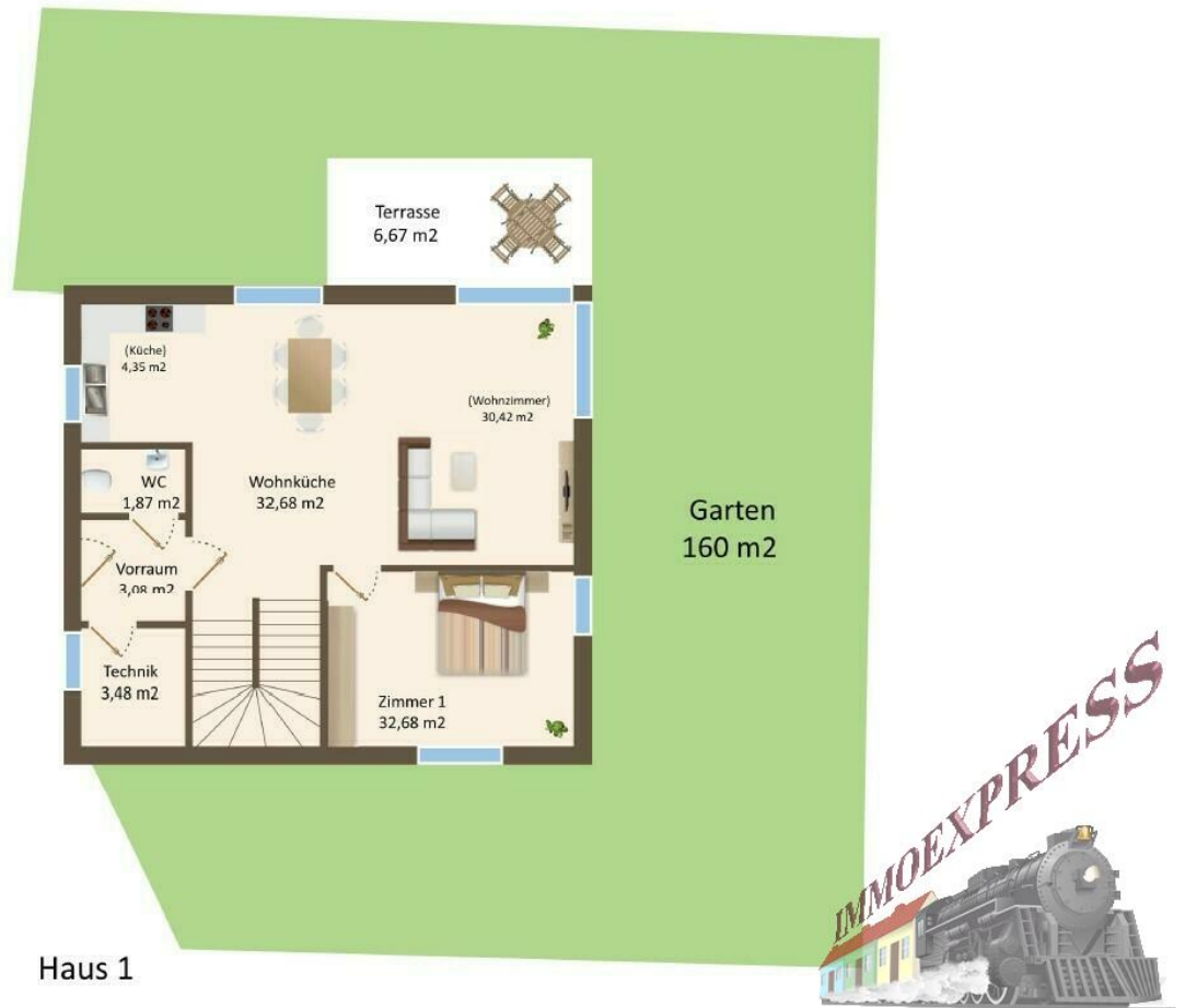
Grundriss EG Haus 1