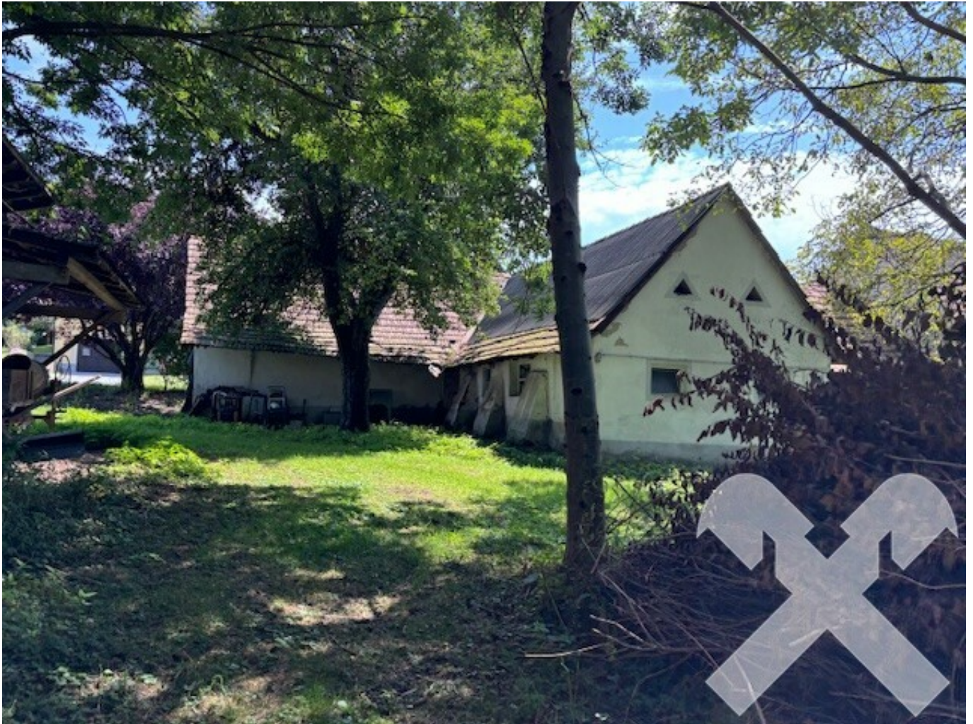
Westansicht mit Grund