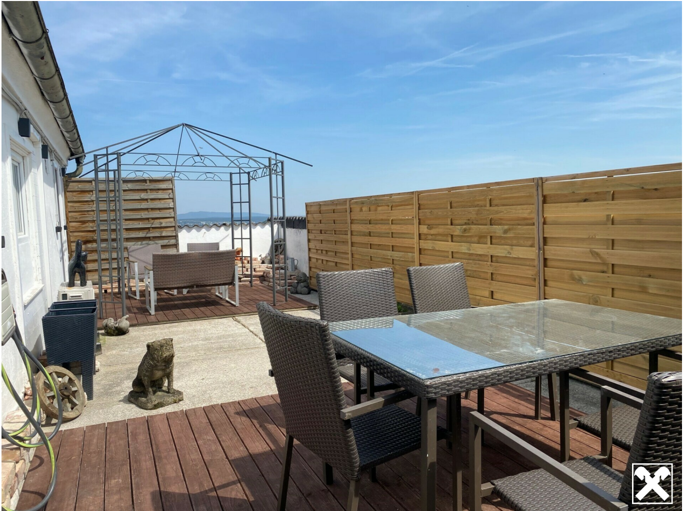
Terrasse mit Ausblick