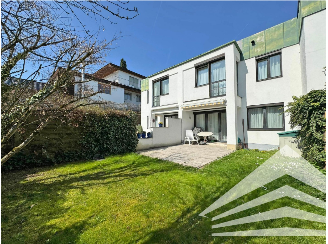
Ansicht vom Garten