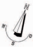
DACHGESCHOSS M 1:100