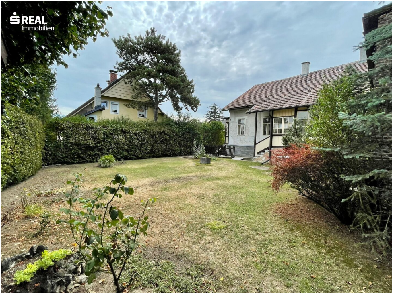
Garten Perspektive 1