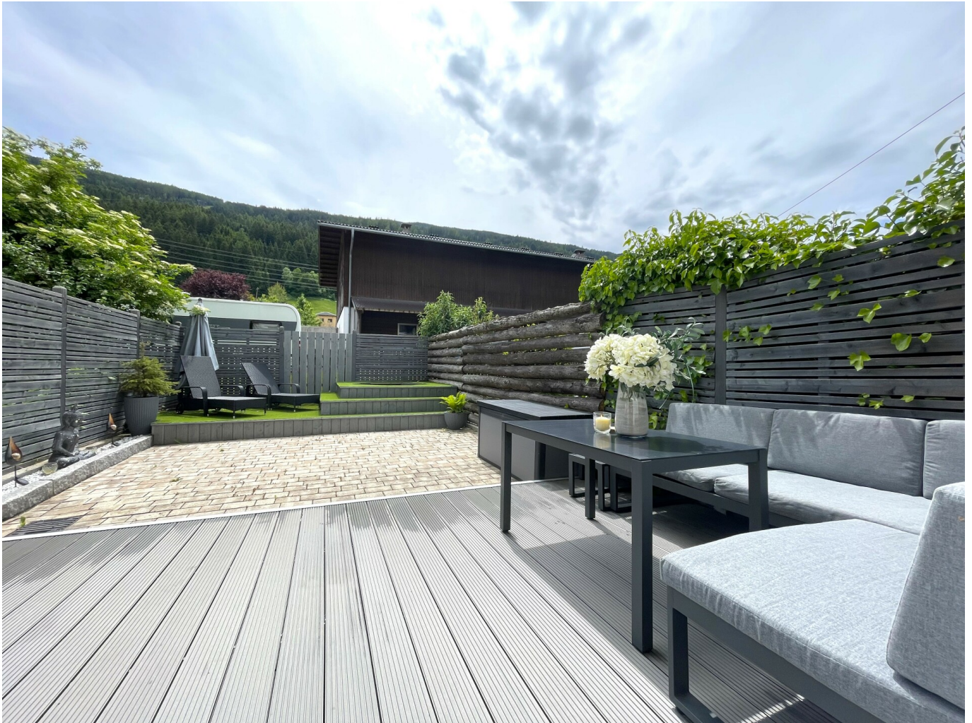
Südterrasse & gepflasterter Garten