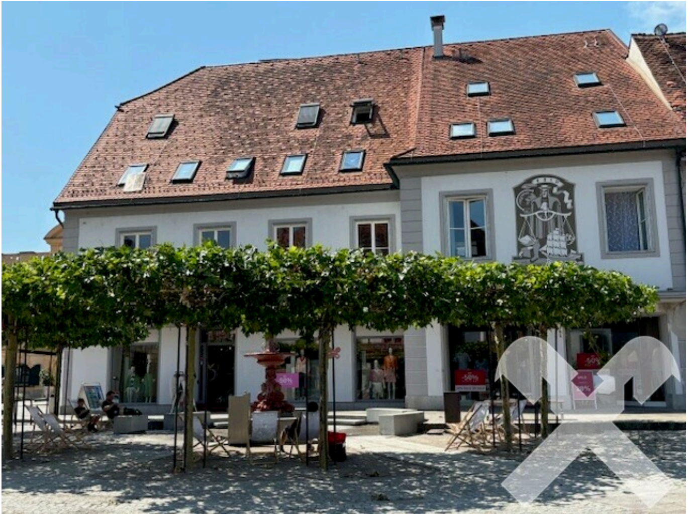
Stadthaus Hauptplatz 1 mit Springbrunnen