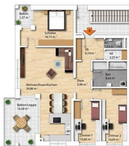
Planskizze HAUS SEE | TOP 4 | 1. OG Hochmüllergasse 26a, 4810 Gmunden