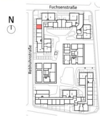
Lageplan ohne Maßstab