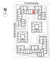
Lageplan ohne Maßstab