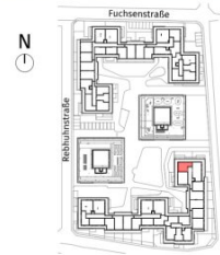
Lageplan ohne Maßstab