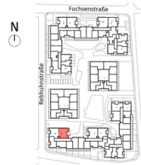
Lageplan ohne Maßstab