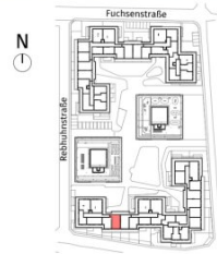
Lageplan ohne Maßstab