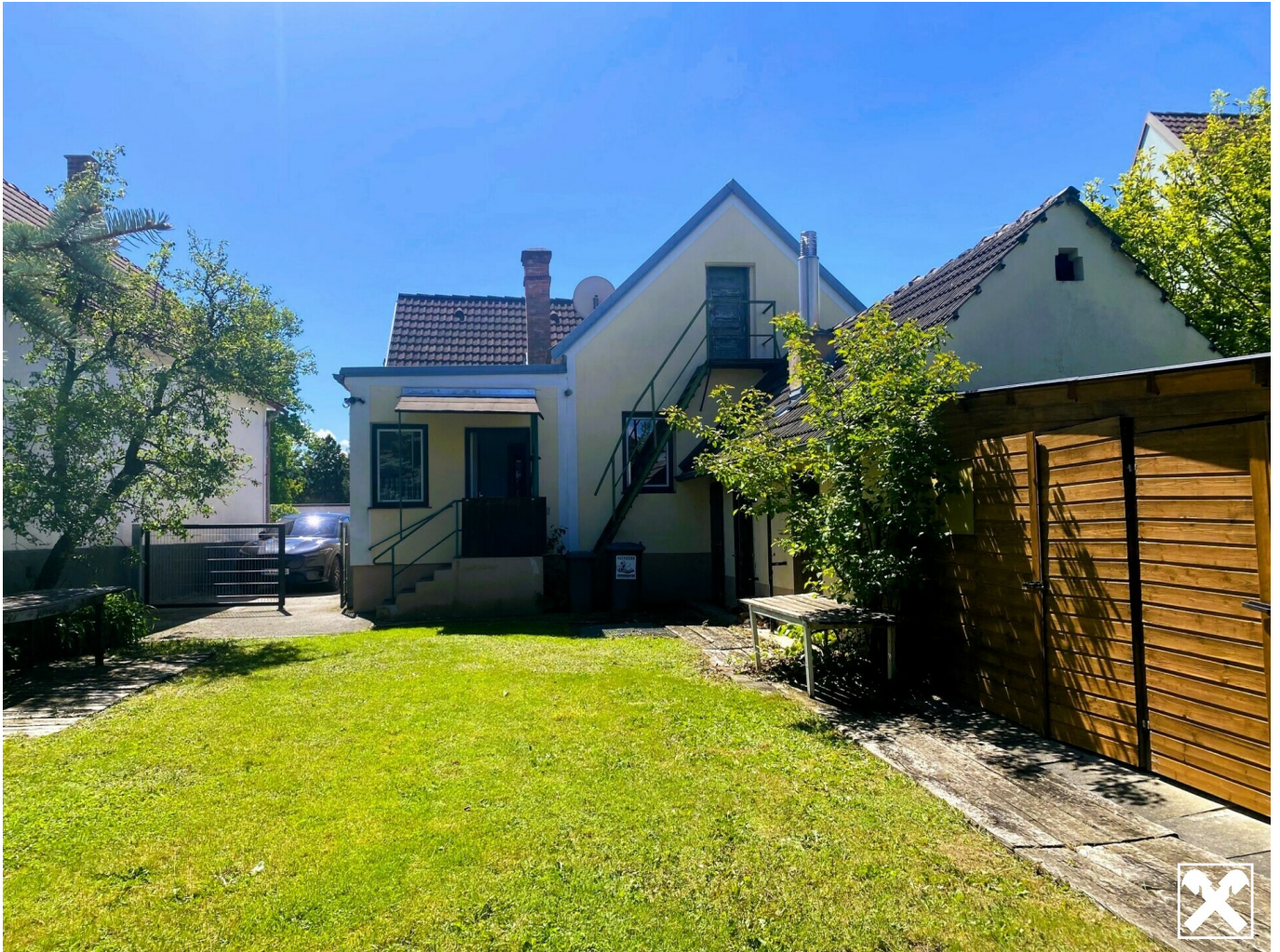
Hausfront Einfahrt, Eingang