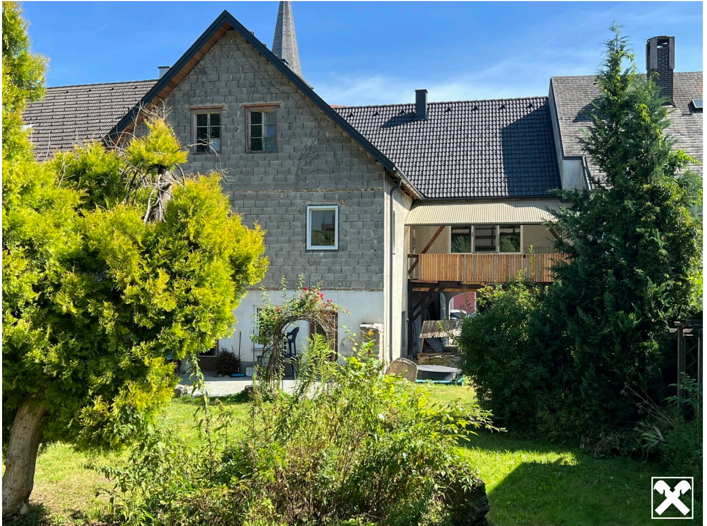
Aussenansicht von Garten aus