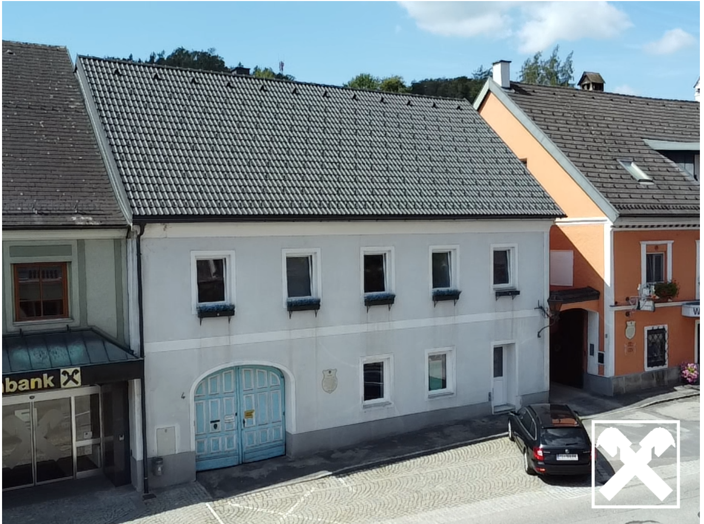
Drohnenaufnahme Haus marktseitig