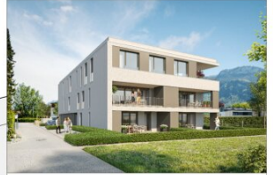
enderstraße 26, altach lageplan