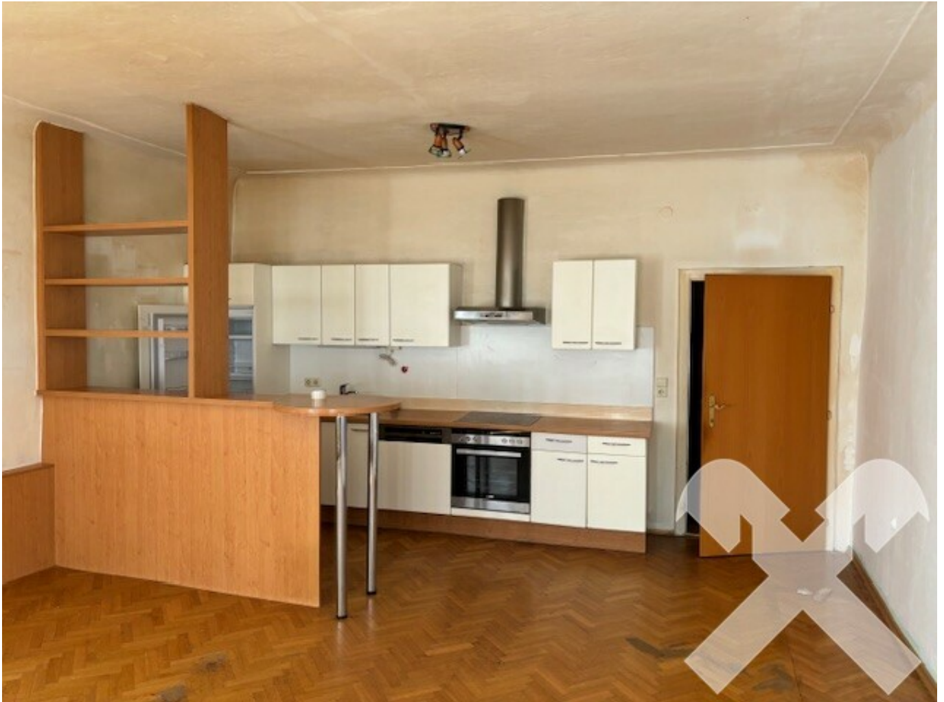
Wohnbereich mit Küche