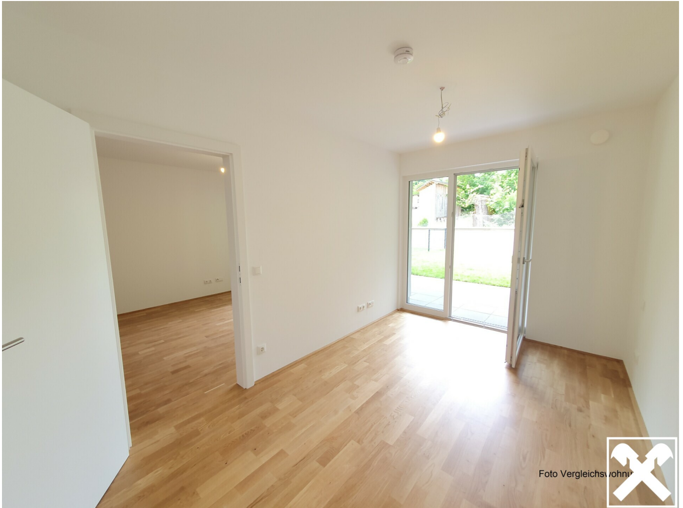
Zimmer Vergleichswohnung mit fertigem Boden (1)