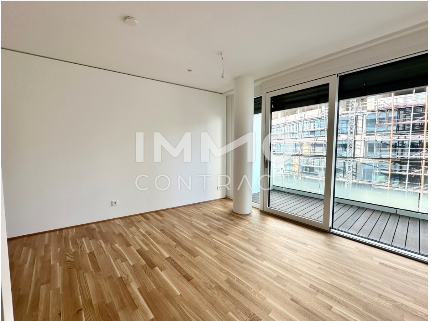
View 1 Zimmer 1