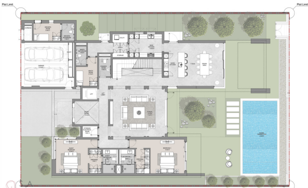
5-Bedroom villa type A- Ground floor plan