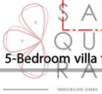
5-Bedroom villa type A- First floor plan