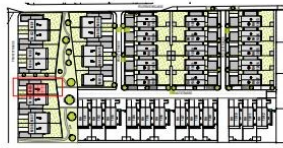
Lageplan M 1:2000