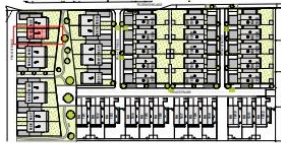
Lageplan M 1:2000