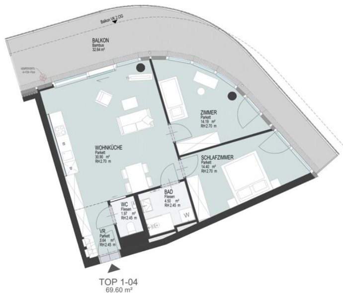
TOP 1-04 69.60 m 2

ESB PROJEKT GMBH S+B GRUPE SORAVIA IMMO Donauinsel Wagramer Straße 24, 1020 Wien