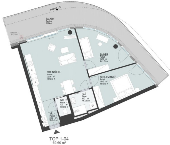
TOP 1-04 69.60 m 2

ESB PROJECT VORAN VERWIRTLICHT DURCH S+M GRUPE SORAVIA IMMO Donauinsel Regener Straße 2A, 1020 Wien