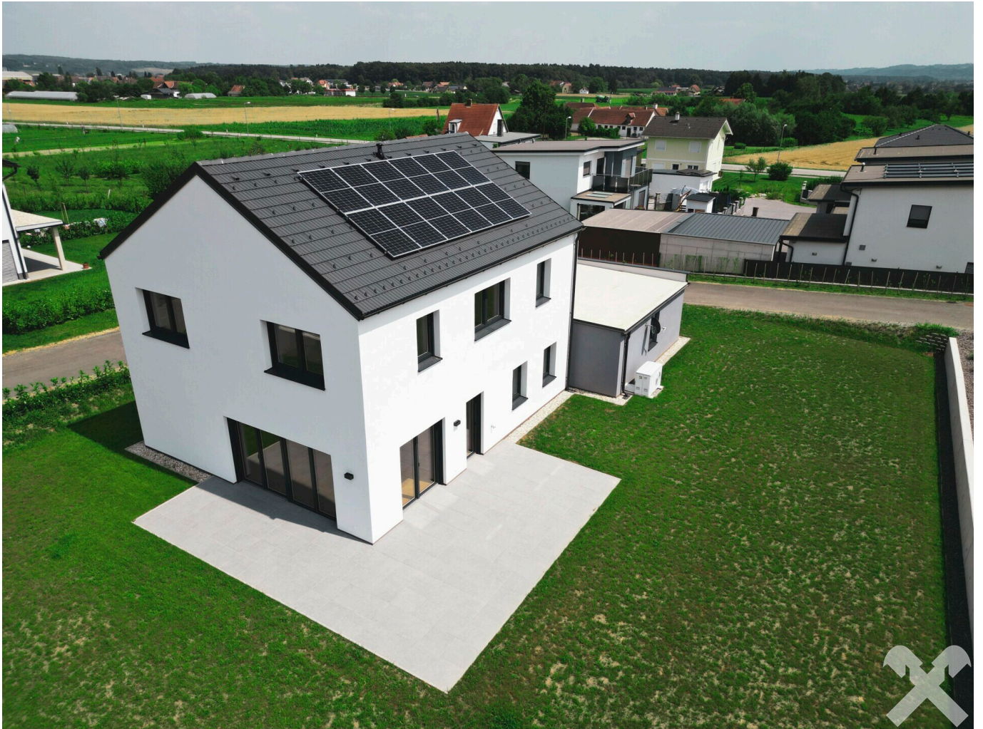
Ansicht von oben