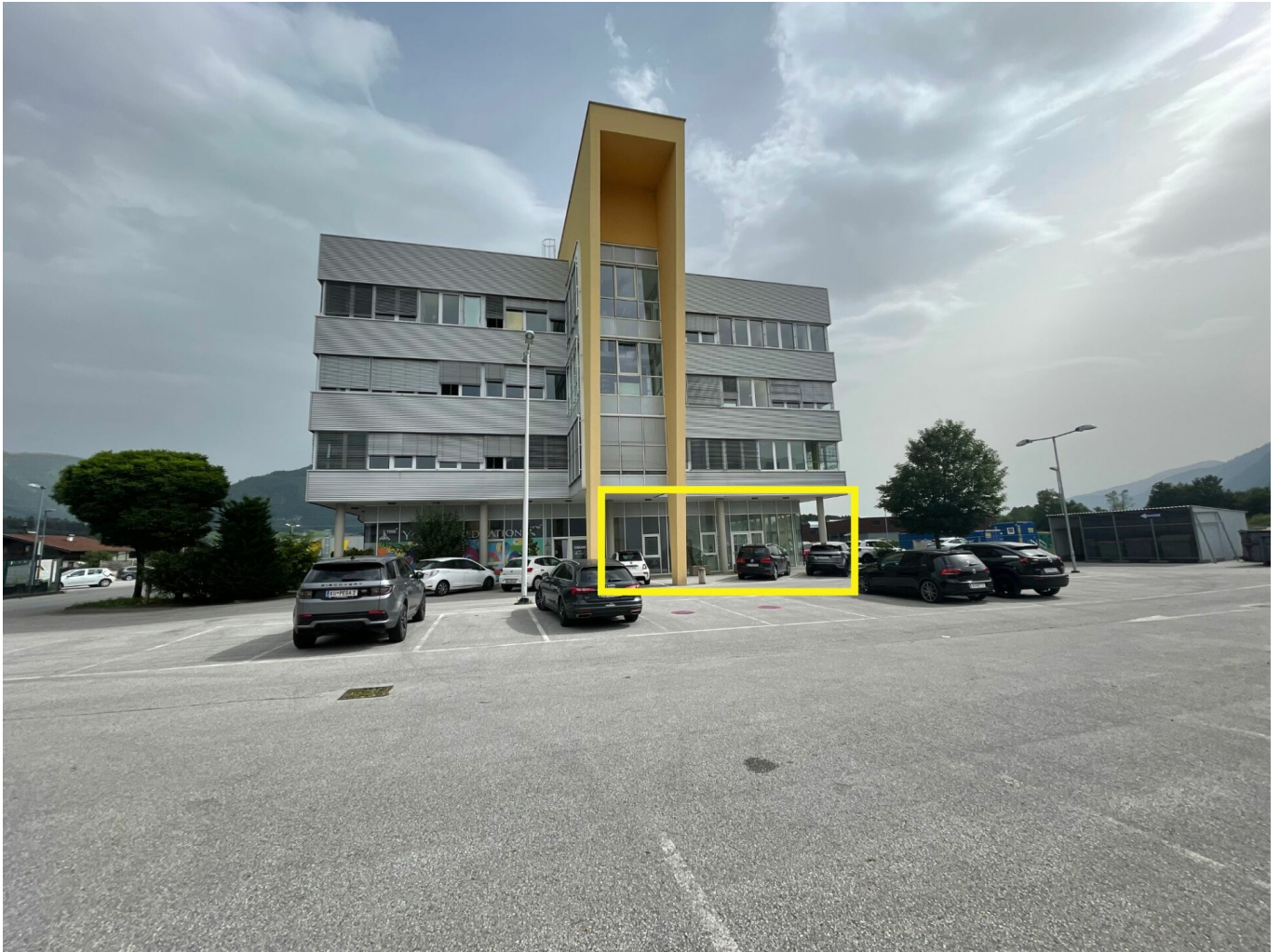
Außenansicht / Eingang