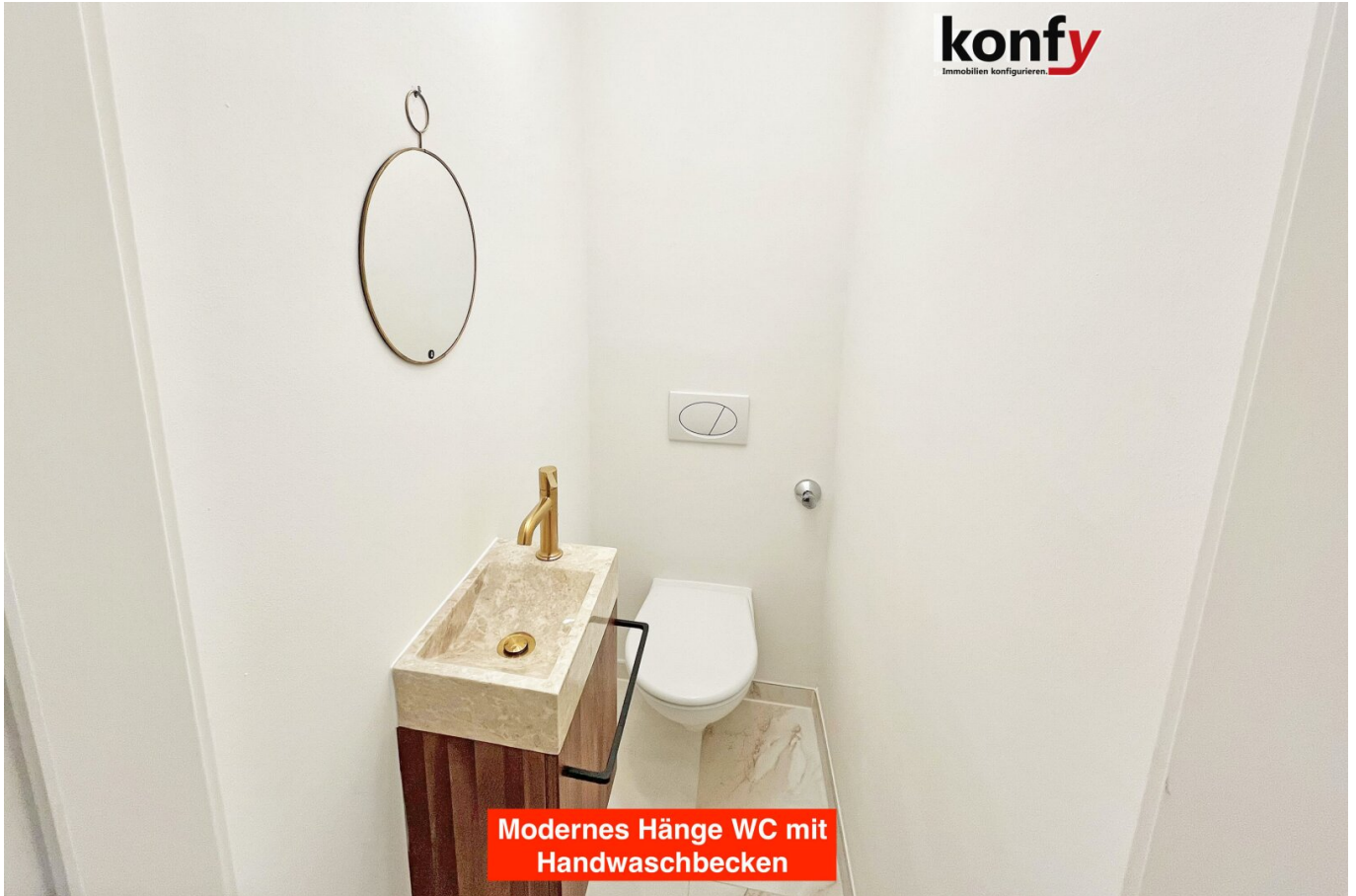
Modernes Hänge WC mit Handwaschbecken