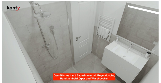
Gemütliches 4 m 2 Badezimmer mit Regendusche, Handtuchheizkörper und Waschbecken