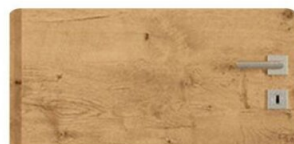
RÖHRENSPAN | Eiche