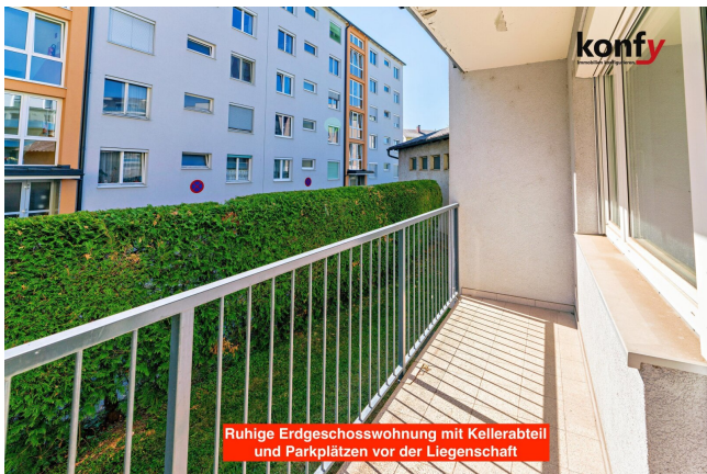
Ruhige Erdgeschosswohnung mit Kellerabteil und Parkplätzen vor der Liegenschaft