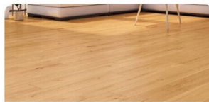
VINYL | Classen