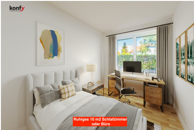
Ruhiges 10 m 2 Schlafzimmer oder Büro