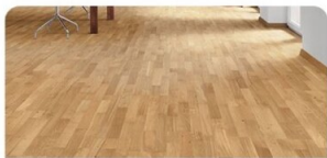
PARKETT | Eiche