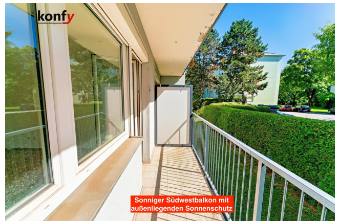
Sonniger Südwestbalkon mit außenliegendem Sonnenschutz