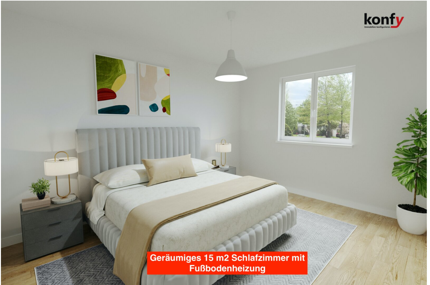
Geräumiges 15 m 2 Schlafzimmer mit Fußbodenheizung