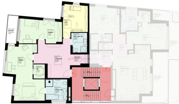
GRUNDRISS 200 1:100 TOP 3+4