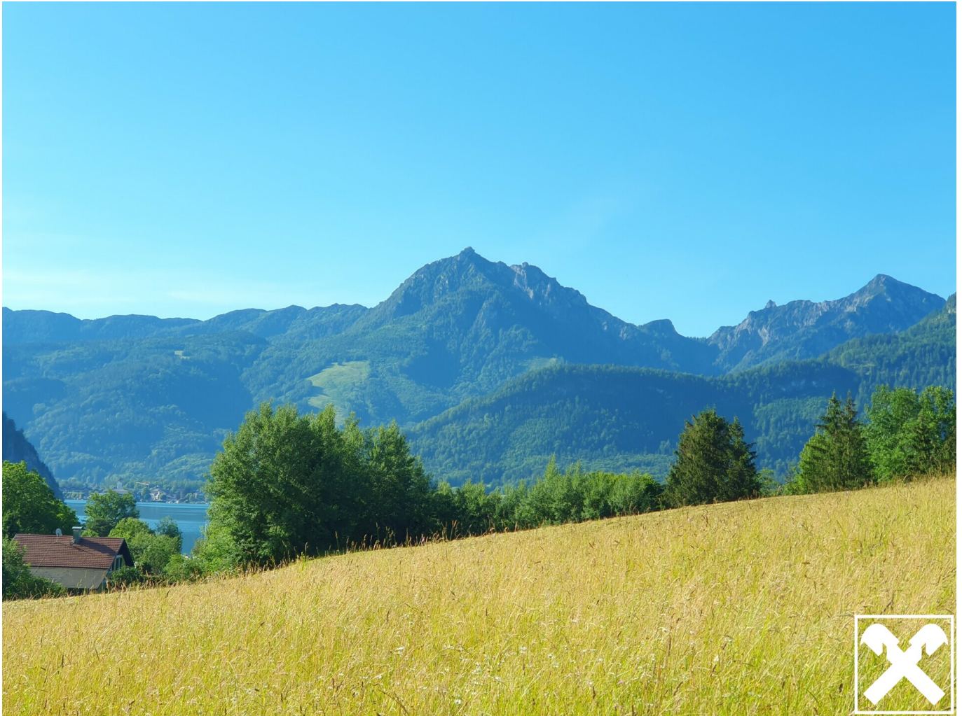
See- und Bergblick (1)