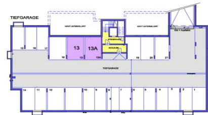
KELLERABTEIL im 1.OG