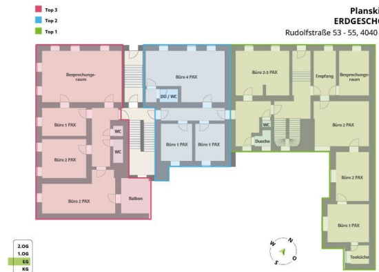
Planskizze ERDGESCHOSS Rudolfstraße 53 - 55, 4040 Linz

Die vorliegenden Planunterlagen dienen der groben Orientierung und können in Fläche und Aufteilung vom Ist-Stand abweichen. Kein Maßstab. Der Vermittler übernimmt für die Richtigkeit keinerlei Haftung. Die abgebildeten Möbel und Einrichtungsgegenstände sind lediglich symbolhaft dargestellt und nicht Teil der Immobilie. Plan: PROJETAS