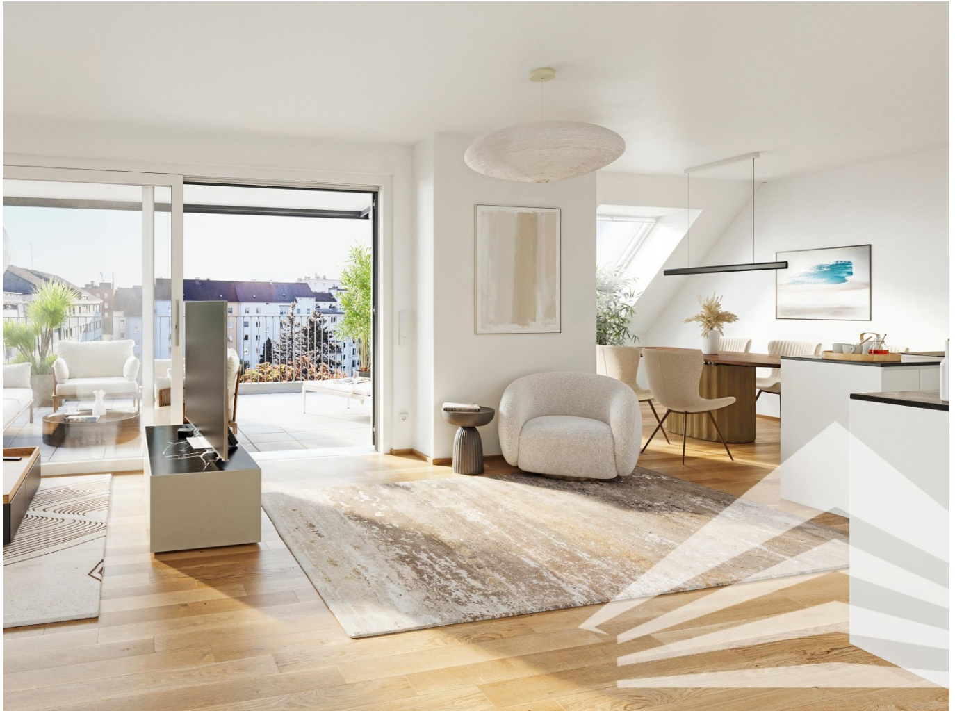
Symbolfoto Top 2.14