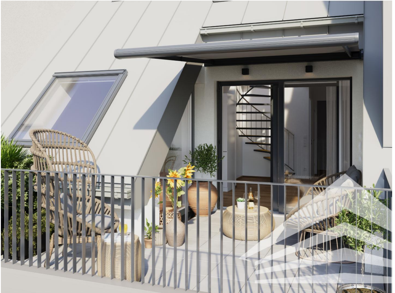
Außenvisualisierung Top 1.14