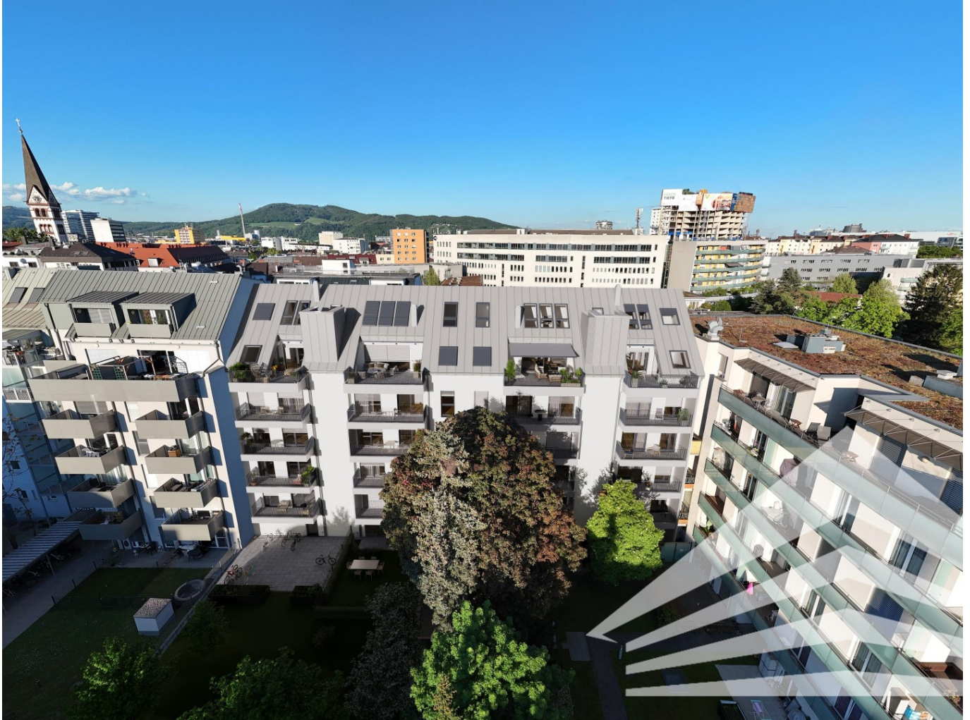
Symbolfoto Außenvisualisierung Hof