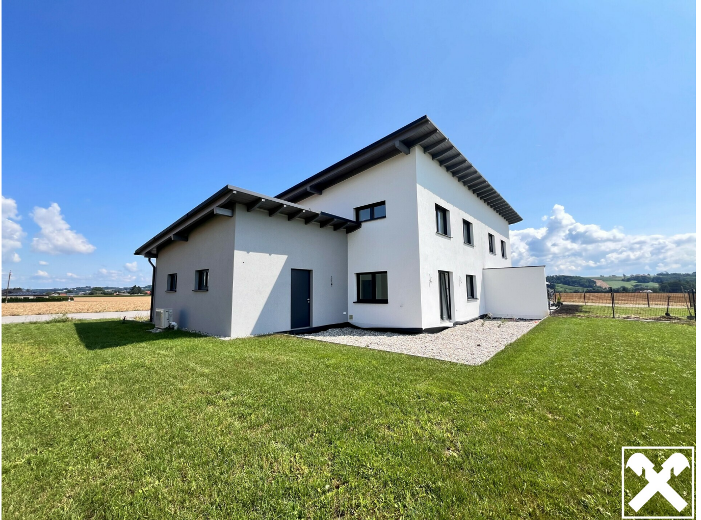
Ansicht der Doppelhaushälfte