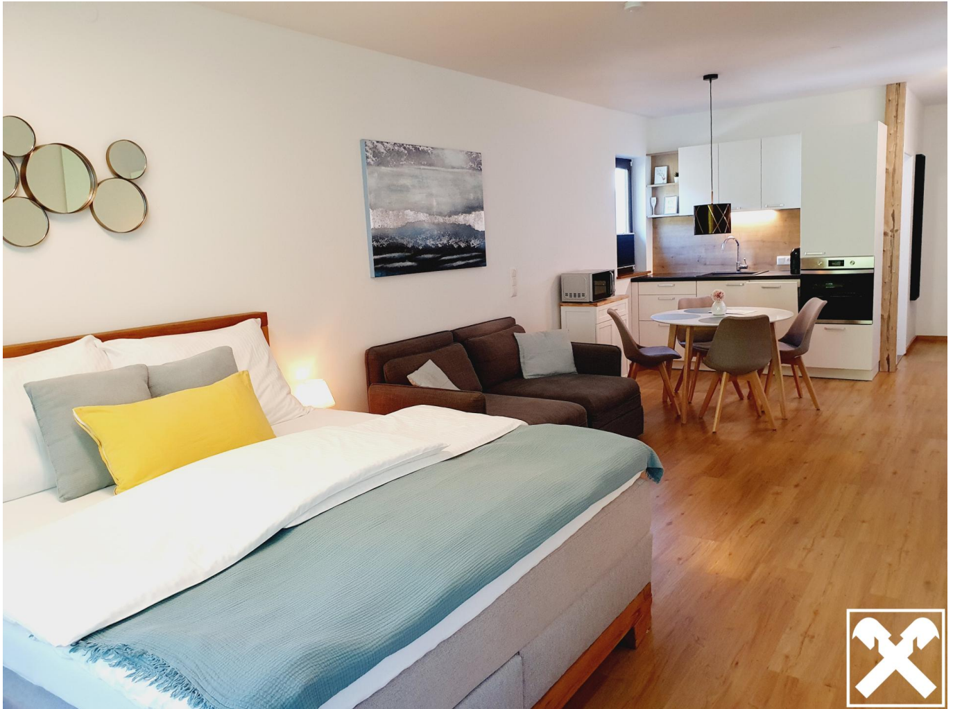
Appartment 3 - Richtung Küche