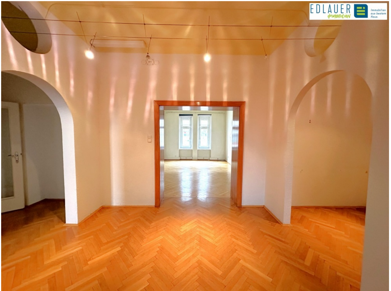
1.OG Vorraum (2)