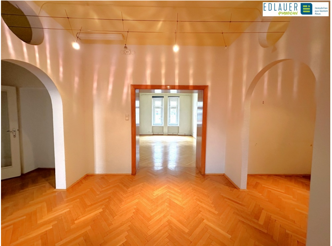
1.OG Vorraum (2)