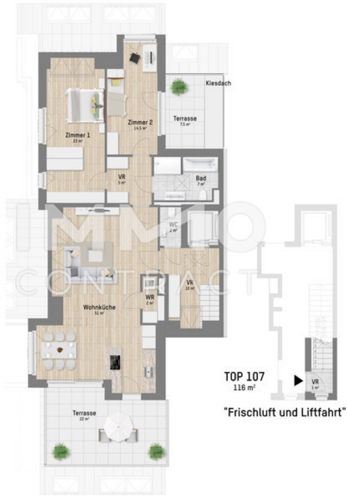
TOP 107 116 m² "Frischlufft und Liftfahrt"