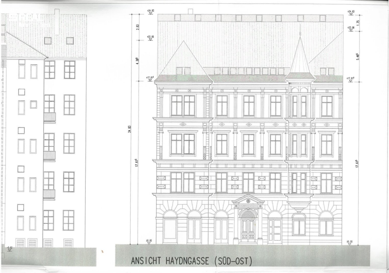
ANSICHT HAYDNGASSE (SÜD-OST)