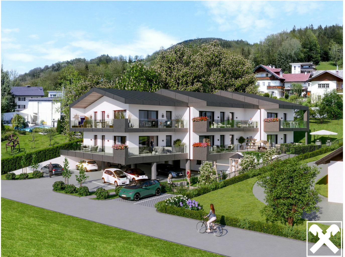
Mondsee Sonnenhang - Aussen