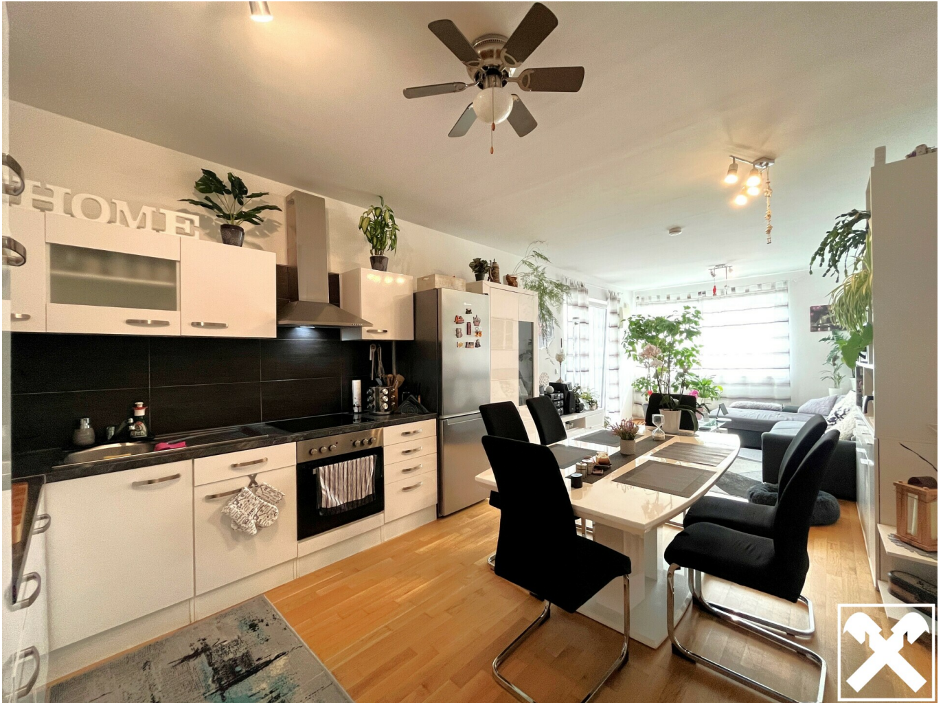
Küche mit Essbereich