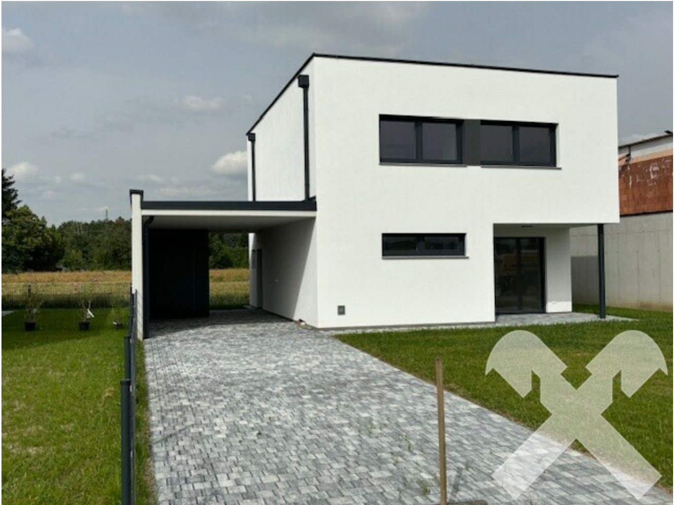
Einfamilienhaus mit Doppelcarport