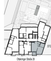
Ottakringer Straße 26