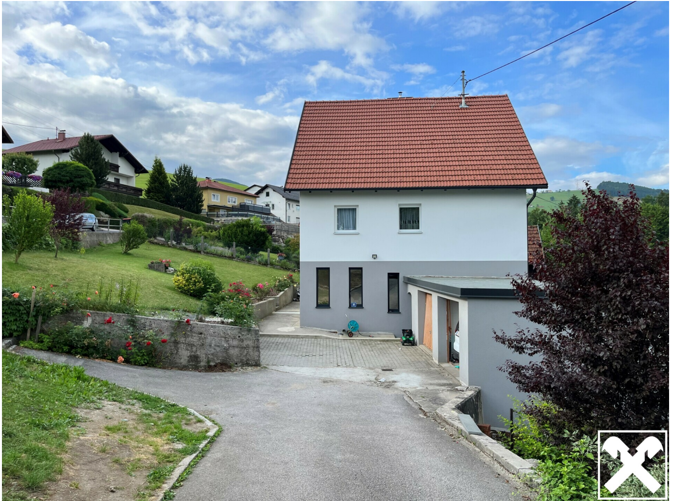
Ansicht Richtung Süden