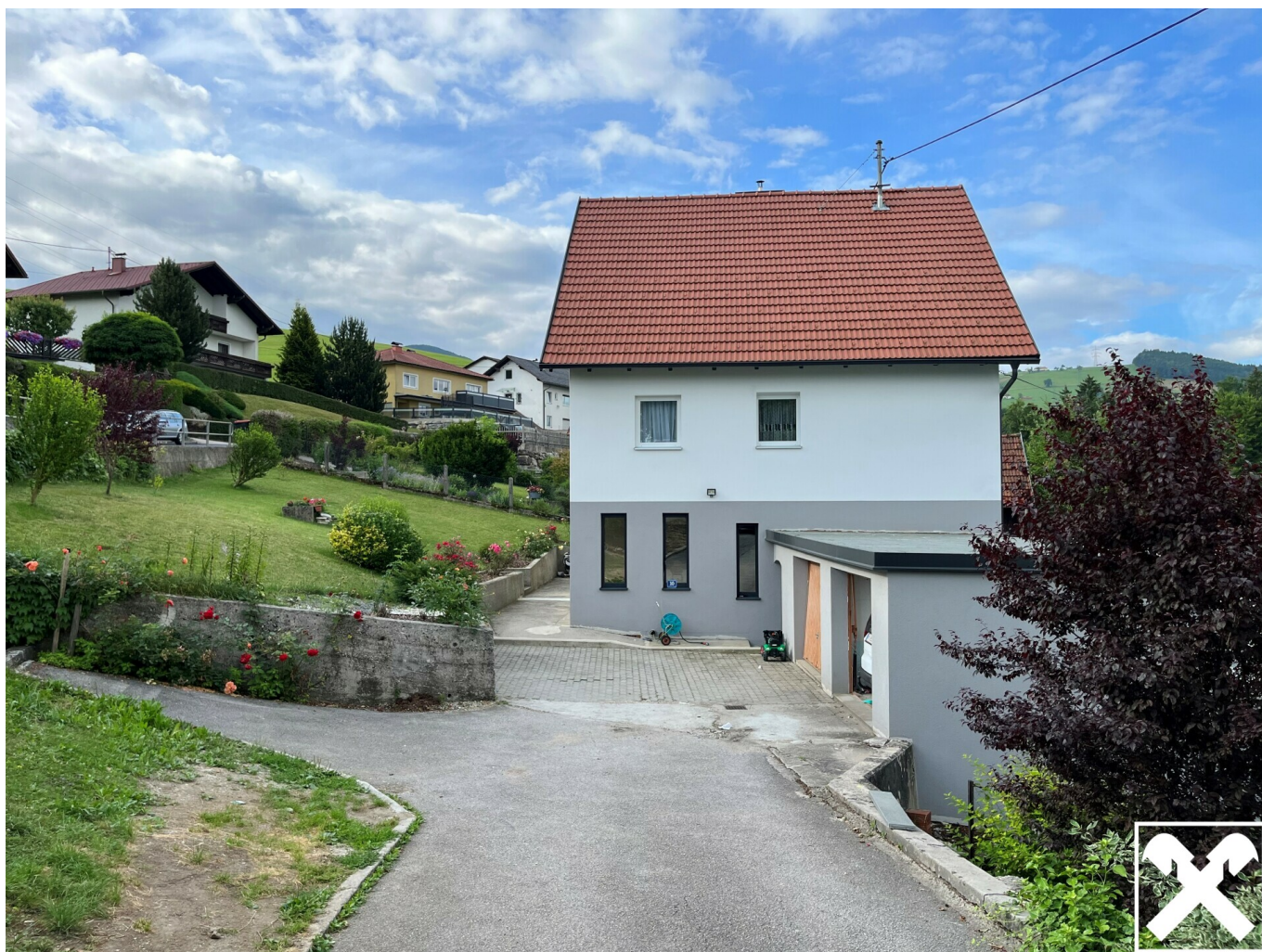
Ansicht Richtung Süden