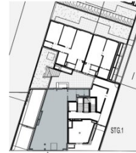
Geschäftsengang Ottakringer Straße 26