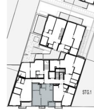
Ottakringer Straße 26