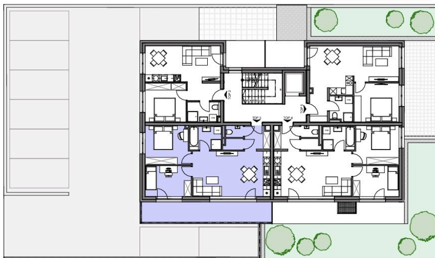
ÜBERSICHT 1.OG M=1:250