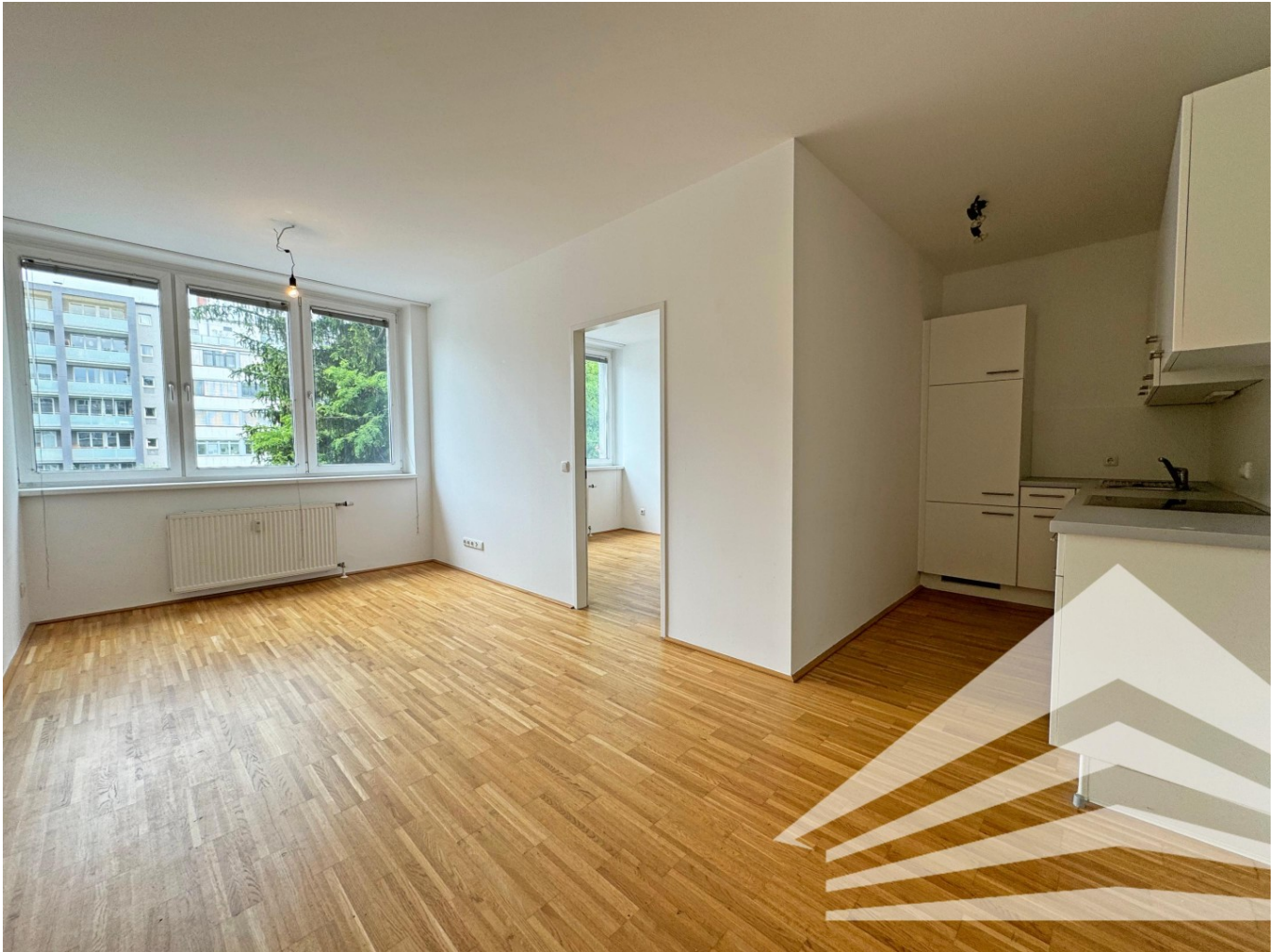
Wohnzimmer | Küche